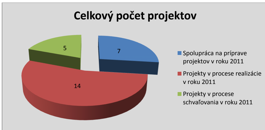
Graf č.2 Počet projektov za rok 2011 podľa jednotlivých cieľových skupín